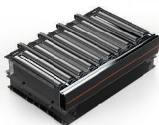
KP02 顶升移栽 模块 24V