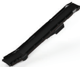
CT02 Belt Conveyor 下坡 400V