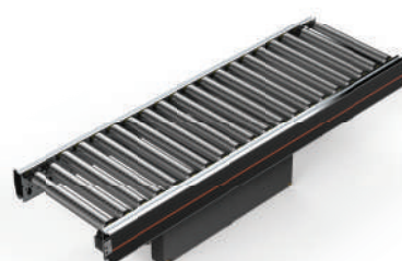
CT01 Roller Conveyor 直线 400V