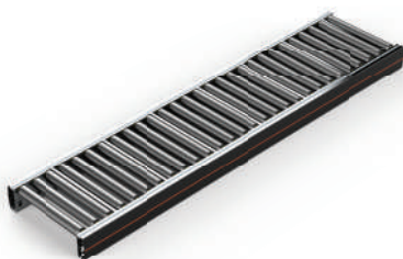
CT01 Roller Conveyor 无动力 辊筒输送机