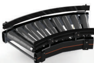
CT01 Roller Conveyor 转弯 24V