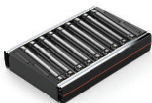
CT01 Roller Conveyor 靠边机 24V