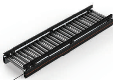
CT01 Roller Conveyor 直线 24V