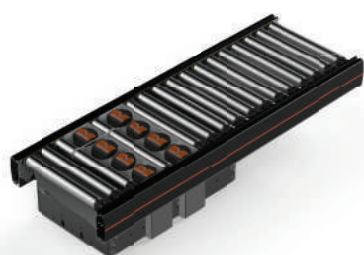
KP01 气动顶升 模块 24V