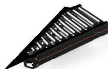
CT01 Roller Conveyor 合流 24V