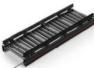
CT01 Roller Conveyor 直线 积放 24V